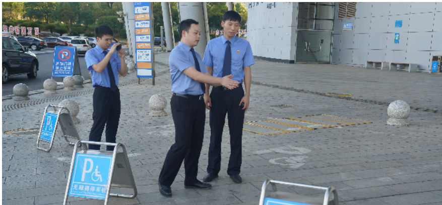
检察官对市体育中心无障碍设施建设管理情况进行调查取证。

早在今年2月,该院开展无障碍环境建设检察公益诉讼专项监督行动,发现辖区无障碍环境建设存在缺失、不规