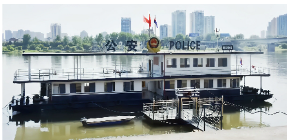
武陵公安 1 号趸船。

这是常德沅澧水域最大的一艘公安趸船。趸船总长 35 米,宽 10 米,总吨位 355,共两层,设有民警办公区域和生活区域。该趸船交付后,不仅解决了武陵公安巡逻艇无处可靠的历史,还给武陵公安分局水上派出所增添了一个水上工作平台,直接延伸至沅江水面一线,集水上巡逻队、水上警务室职能于一体,担负水上巡逻、水上综合执法、接受群众报警求助等职能。