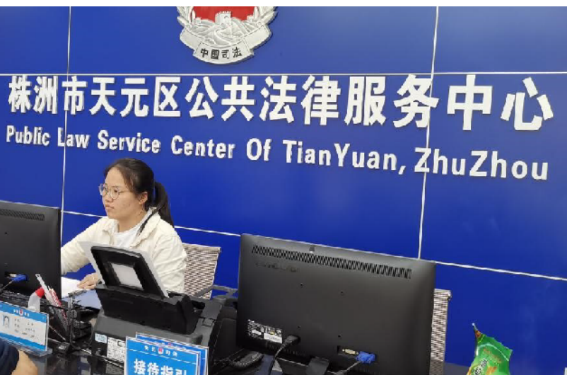
←株洲市天元区公共法律服务中心。

淅口法院秉持全国法院一盘棋的理念,着力克服案多人少压力,积极协助兄弟法院执行,凝聚执行合力,体现了进一步切实解决执行难的决心。