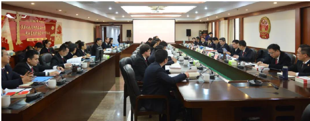
“法官读典”研讨活动现场。

郴州市中级人民法院近日举办了“法官读典”研讨活动，旨在通过深入学习法律典籍，提升法官的法治素养和审判能力。活动邀请了多位法学专家进行专题讲座，并就当前司法实践中遇到的难点问题进行了深入探讨。与会法官纷纷表示，此次研讨受益匪浅，将进一步增强责任感和使命感，为公正司法提供坚实保障。