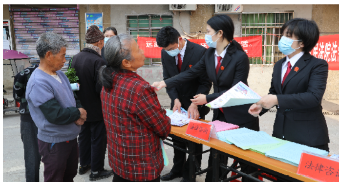
法院干警送法下乡。

法院干警深入基层，开展普法宣传。通过摆摊设点，向群众发放法律宣传资料，解答法律咨询，提高群众的法律意识和维权能力。此举得到了群众的广泛好评，有效促进了法治社会的建设。