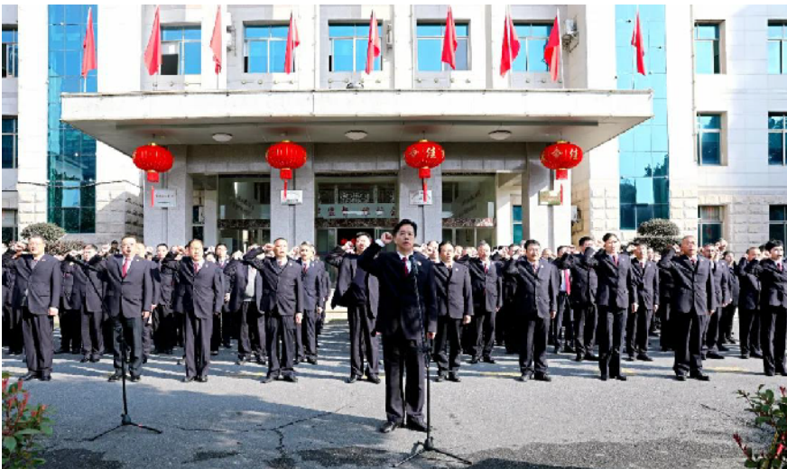
郴州市检察院举行升国旗暨检察官宣誓仪式。

件中感受到公平正义。要弘扬艰苦奋斗、吃苦耐劳的精神,甘做“老黄牛”。坚持全面从严治检与从优待检相结合,努力让检察干警有更多的获得感幸福感和职业尊荣感。全市检察机关要立足新发展阶段,贯彻新发展理念,构建新发展格局,铆足“牛”劲、激发“牛”力,勠力同心,担当作为,创造更“牛”的业绩,推动“十四五”时期全市检察工作开好局、起好步,为实施“新理念引领,可持续发展”战略,全力打造“一极四区”,谱写服务保障郴州经济社会高质量发展的检察新篇章。 随后,江涛率院领导班子先后到机关各内设机构、服务窗口、值班岗位、食堂、物业处,挨个给干警职工拜年送祝福,为新年工作加油鼓劲。 邝静云 郑宁倩