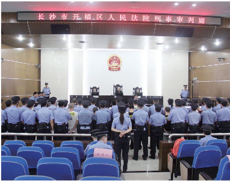
天狮系列案集中宣判。