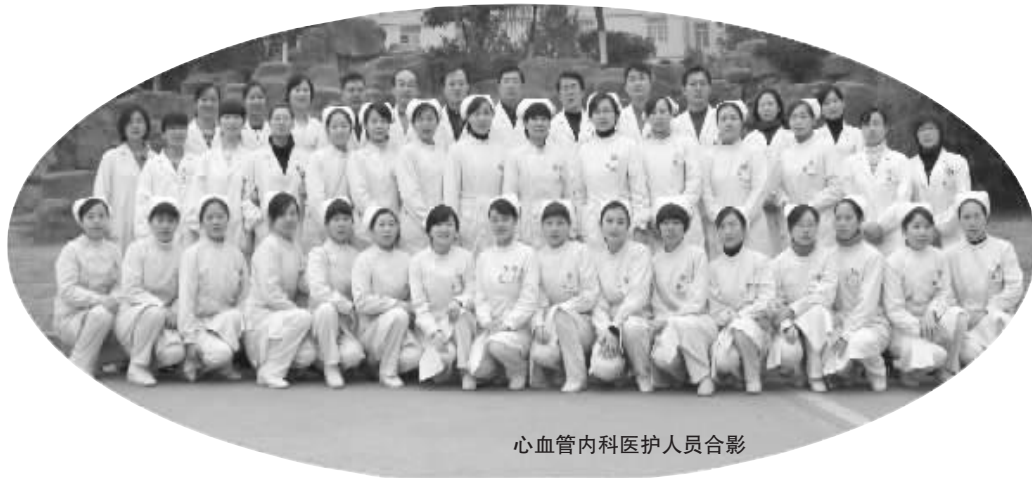
心血管内科医护人员合影