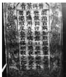
故宫内百年普洱茶碑文

建国后,普洱茶膏被列入国家重点保护项目,清代御医陈贺题写的百年碑文在故宫内存放至今。而神九搭载返回的普洱茶叶正是“茶膏”专用普洱茶叶。