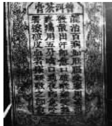
故宫内百年普洱茶膏碑文

建国后,普洱茶膏被列入国家中药重点保护项目,清代御医陈贺题写的百年碑文在故宫内存放至今。而神九搭载返回的普洱茶叶正是“茶膏”专用普洱茶叶。