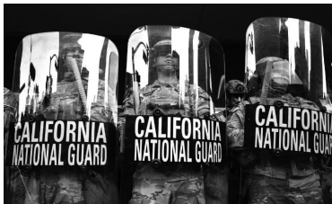
▲6月10日,洛杉矶骚乱中的加州国民警卫队员

作为美国三军统帅,美国总统理论上能够调动的“武力”有多少?皮尤研究中心6月6日援引美国国防部国防人力数据中心(DMDC)的统计称,截至今年3月底,除国民警卫队等预备役人员外,美国有132万现役军人,其中陆军人数最多,有大约45万人;其次,是海军,约有33.4万人;之后是空军(31.7万)和海军陆战队(16.8万),而海岸警卫队和太空部队的规模要小得多,各自只有不到5万名现役军人。根据DMDC的数据,绝大多数美国现役军人(86%)驻扎在国内,14%驻扎在国外。在每个州工作的现役军人人数差别很大,加州拥有最多的现役军人,约有15.75万人。