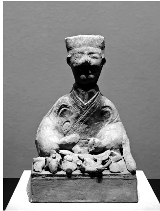
四川博物院藏东汉至三国时期庖厨俑,案板最左侧为饺子