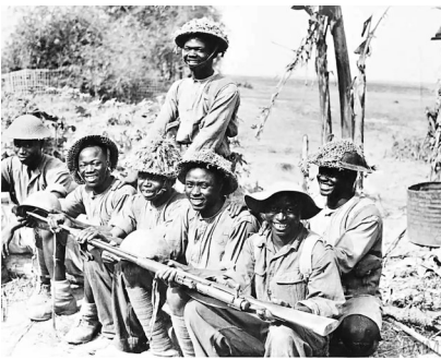
在缅甸抗击日军的非洲士兵

非洲部队除了在缅甸战场前线作战,成为抗击日军的有生力量,另一重要角色是“开路先锋”。由于地形原因,缅甸战场很难使用机动车辆,大多数补给品需要由骡子和不稳定的空投运到前线阵地,在热带丛林中也需要频繁渡河,所需的船只必须由士兵自己操作。非洲士兵依靠顽强的精神开辟了一条通往加拉丹河岸的吉普车道。在这些行动中,西非第81师的机动性充分展现出来,他们曾在6周内穿越120公里的茂密丛林深入日军后方。史料记录了1944年西非第81师士兵追击日军并将其击败的场景:士兵在漆黑的密林中搬运突击艇,4人协作顶着横木负重前行,其间道路曲折、陡升骤降,连方向都无法分辨,即便是未负重的英国士兵也感到跋涉艰