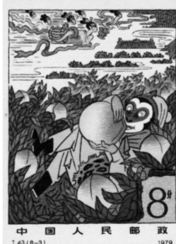
中国人民共和国 8分

在引起轰动的时候,一个上海的小学生发现了这套邮票设计上的瑕疵。这个瑕疵说大不大,说小也不小——在“战哪吒”“蟠桃会”“八卦炉”这3枚邮票上,孙悟空腰间一概围上了虎皮裙。熟悉《西游记》的人都知道,孙悟空穿上虎皮裙,是在第十四回,拜唐僧为师以后——取经路上,孙悟空打死一头差点吃了唐僧的猛