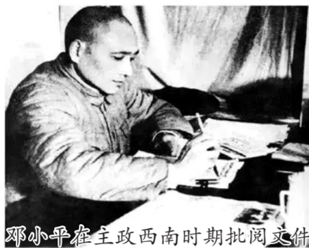
邓小平在西南主政时期批阅文件

邓小平强调文风,要求言简意赅,反对不真实、八股调。1950年7月,他给中央写的报告,涉及方方面面的问题,也不过一两千字,毛泽东大加赞赏,也正是在此时,他说出了那句“至高评价”：“看邓小平的报告好像吃冰糖葫芦！”在他对邓小平报告的批示中,经常有“此报告好”“内容极好”“极可宝贵”“非常好”