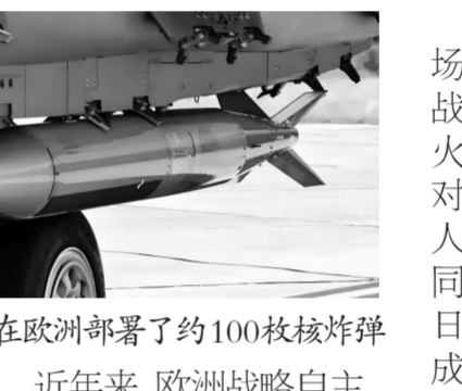
▲美国在欧洲部署了约100枚核炸弹

此外,《联合国海洋法公约》也是美国不得不顾及的因素,明晃晃地违反国际法,最终可能引火烧身,迎来多国的共同指责,这样的地缘