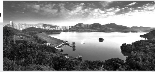
▲东深供水工程——深圳水库

2025年3月1日,是东江水供港60周年的日子。1963年,香港遭遇罕见严重干旱,为缓解香港供水短缺,东江-深圳供水工程(简称“东深供水工程”)于1965年3月1日建成投入使用。如今,东江水占香港淡水供应总量的70%以上,东深供水工程60年来一直全力保障香港供水生命线。