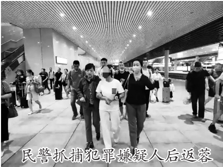
民警抓捕犯罪嫌疑人后返警署

憨态可掬的大熊猫,深受大家喜爱。在网上,直播和短视频平台的兴起,引得不少网友在线围观国宝;在线下,一些大熊猫人气暴涨,游客纷纷前来一睹“网红”熊猫风采。