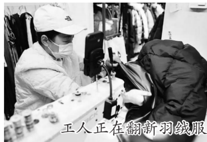
正人正在翻新羽绒服