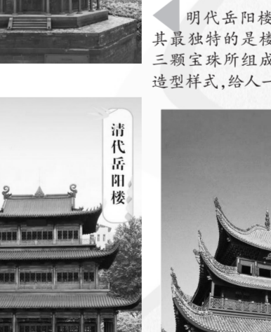
明代岳阳楼 明代岳阳楼蓝本来自于宫廷画院,其最独特的是楼顶饰物,由六条飞龙和三颗宝珠所组成,同时外加六角阁楼的造型样式,给人一种方圆结合之感。