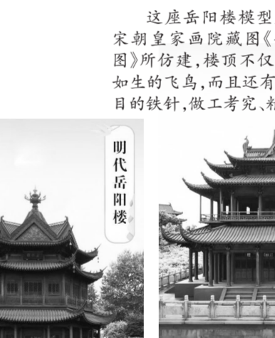
宋代岳阳楼 这座岳阳楼模型是根据宋朝皇家画院藏图《岳阳楼图》所仿建,楼顶不仅有栩栩如生的飞鸟,而且还有一根醒目的铁针,做工考究、精致。