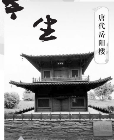
唐代岳阳楼 这座唐朝时期的复原模型是根据现存的唐朝建筑和历史考古信息的发掘,经过专家精心研究而制作出的,可谓是小家碧玉。