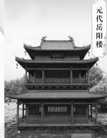
元代岳阳楼 这座模型来源于元末明初的画家夏永的《岳阳楼图》,此时岳阳楼的高度提升了不少,上下分为三层,层高也很大,外部造型很方正。