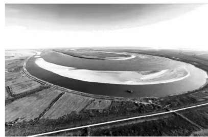
岳阳市君山区江豚湾景区

洞庭湖尤其是君山水域仍占相当大的比重。2022年2月底,农业农村部发布江豚考察数据,称长江江豚种群数量为1249头,其中分布东洞庭湖君山一带的为162头,占总数的12.97%。