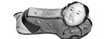
▲金代磁州窑褐彩妇人枕

枕头自原始时期出现后,逐渐成为人们日常生活中的一种卧具,其材质、造型、工艺和装饰纹样随着时代的发展不断变化。