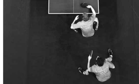
8月9日,在巴黎奥运会乒乓球男团金牌赛中,中国队战胜瑞典队,获得冠军。中国组合马龙(上右)王楚钦(上左)与瑞典组合安东·卡尔伯格(下左)克里斯蒂安·卡尔松(下右)在比赛中。