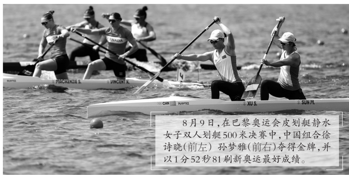
8月9日,在巴黎奥运会皮划艇静水女子双人划艇500米决赛中,中国组合徐诗晓(前左)孙梦雅(前右)夺得金牌,并以1分52秒81刷新奥运最好成绩。

巴黎奥运的璀璨舞台上,每一刻都闪耀着梦想与荣耀的光芒。这组精心挑选的图片,不仅定格了运动员们冲刺终点的激情瞬间,也捕捉到了他们汗水与泪水交织的感人画面。它们如同时间的胶囊,封存了巴黎奥运会上那些令人心潮澎湃、难以忘怀的精彩时刻,让这份记忆在每个人的心中永久绽放,熠熠生辉。