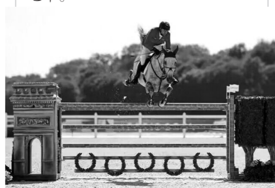
8月6日,德国选手库库克在马来个人场地障碍赛决赛中夺得冠军。