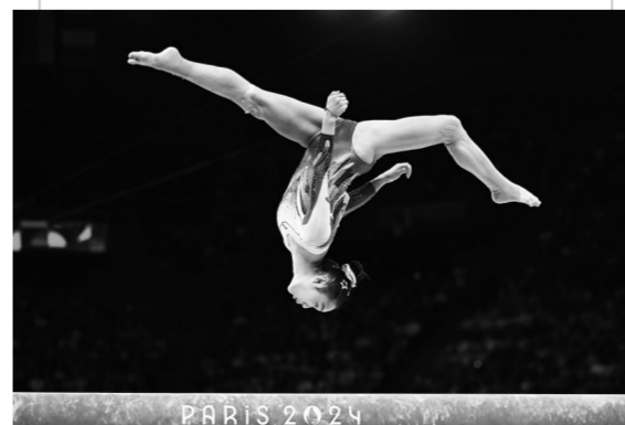
8月5日,中国选手周雅琴在平衡木比赛中获得银牌。

巴黎奥运的璀璨舞台上,每一刻都闪耀着梦想与荣耀的光芒。这组精心挑选的图片,不仅定格了运动员们冲刺终点的激情瞬间,也捕捉到了他们汗水与泪水交织的感人画面。它们如同时间的胶囊,封存了巴黎奥运会上那些令人心潮澎湃、难以忘怀的精彩时刻,让这份记忆在每个人的心中永久绽放,熠熠生辉。