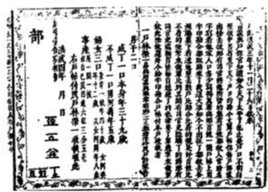
▲明朝安徽祁门人汪寄佛的“户帖”,被称为世界上现存最早的“户口本”,距今已有600多年

1801年英国举办的国情普查早400余年,英国学者卡尔津惊叹:“这是全球最先推行全国人口普查的明证和榜样!”(摘自《北京日报》)