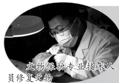
文物保护专业拔尖队员修复文物