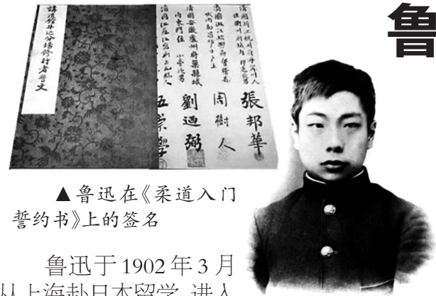
▲鲁迅在《柔道入门誓约书》上的签名

鲁迅于1902年3月从上海赴日本留学,进入东京弘文学院普通科学习。东京弘文学院是一所私立学校,所授课程为日语和西方科学知识。该校对中国儒家文化极为尊重,还特别规定每年的9月28日为“孔子诞辰”,让中国学生去孔子庙行礼。