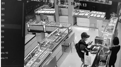
▲涉案人员刷卡买黄金时的监控截图