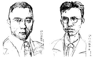
▲选自吴学昭《吴宓与陈寅恪》插图

吴宓(1894—1978)从清华毕业后赴哈佛留学,经同学俞大维介绍,结识也在哈佛留学的陈寅恪(1890—1969)。两人年龄相仿,志趣相投,很快就成为无话不谈的好友,吴宓的日记中就有“以后宓恒往访,聆其谈话”,“寅恪不但学问渊博,且深悉中西政治、社会之内幕……其历年在中国文学、鸣学及诗之一道,所启迪、指教宓者,更多不胜记也。”对陈寅恪给予了很高的评价。