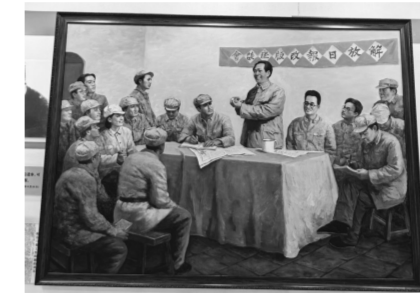
▲延安新闻纪念馆内,解放日报改版座谈会油画。

这一历史性的决定,让“解放日报”这个诞生于延安、成长于战火的光荣名字,从此与上海这座城市紧密相连。此时,一支新闻大队正随军南下。这些新闻战士以有城市办报经验的济南《新民主报》人员为主,还有新华社华东总分社、华东新闻学校、新潍坊报