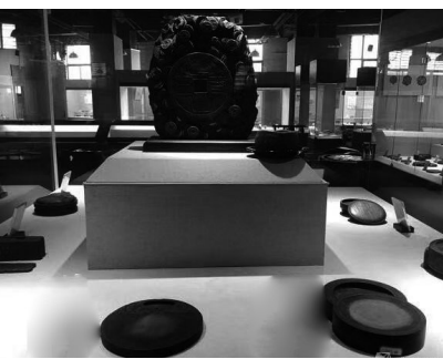
▲盛砚砚台博物馆收藏的砚台

20世纪六七十年代,“无齿芙蓉龙”化石在张家界芙蓉桥乡的巴东组地层中被发现。从此,位于芙蓉桥乡的芙蓉龙化石层迎来了一拨又一拨的发掘工作者和参观者。