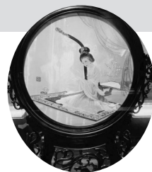
▲中国湘绣博物馆藏《杨玉环》绣品

针法和多种色阶的绣线,在各类底料上充分发挥针法的表现力,精细入微地刻画出物象外形内质的自行特色。一针一线间,大有乾坤。