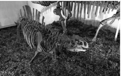
▲湖南省地质博物馆里的“芙蓉龙”骨架

来这里看恐龙的祖先,无齿芙蓉龙!无齿芙蓉龙不是恐龙,而是恐龙的祖先,目前全世界仅有的三具无齿芙蓉龙的化石标本都在国内。