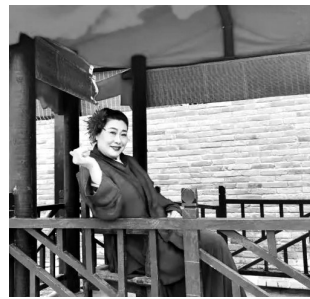
多项实景演出圈粉

记者注意到,上述两个景区出圈的角色“王婆”“小乞丐”在当下年轻人的语境中都有一个新的“定位”——NPC。近年来,越来越多的景区引入NPC,游客与“李白”对诗、与“白娘子”邂逅……在现实和想象之间,游客收获了惊喜和沉浸式体验,也为景区发展打开了新的思路。