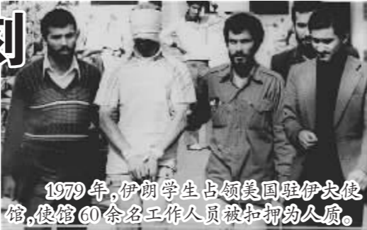
1979年,伊朗学生占领美国驻伊拉克使馆,使馆60余名工作人员被扣押为人质。

尔木兹海峡巡逻的美国“文森斯”号巡洋舰接到情况通报称,6艘伊朗快艇正试图攻击一艘利比里亚油轮。美军立即下令“文森斯”号巡洋舰前往救援。