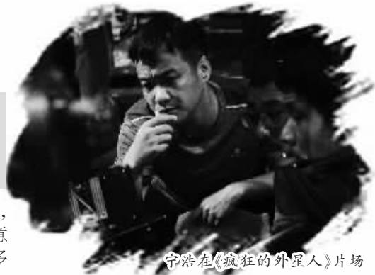
宁浩在《疯狂的外星人》片场