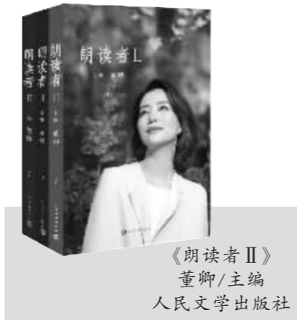
《朗读者II》 董卿/主编 人民文学出版社

我是2002年到北京的,头几年也过着跟大家一样的北漂生活,租房这些都不用再讲。那时候我在西