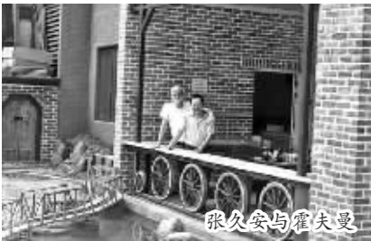
爱玩火车模型的父亲，带出小小理工男