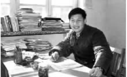
1983 年,在河北正定办公室里的习近平。

“走路要用脚”的意思是:当时红军没有汽车、飞机,部队调动完全靠步行。部队常常要翻山越岭,