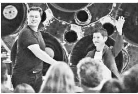
SpaceX首席执行官马斯克(左)宣布,日本亿万富翁前泽友作(右)将成为SpaceX的首位太空旅客。

SpaceX公司首席执行官马斯克称,将对前泽友作进行系统性训练,未来将有多名工程师确