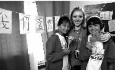
在“海洋”全俄儿童中心,两个中国小姑娘和她们的折纸课老师合影留念。

“在中俄两国友好关系交往历史上,发生过许许多多动人的故事。但2008年汶川地震时俄罗斯政府和人民对中国给予的巨大支持,尤其令人难忘。邀请灾区2000余名孩子赴俄疗养,绝对是动人的一笔。”中国驻俄使馆先