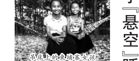
吊床上的柬埔寨女孩

东南亚国家常年潮湿闷热,人们普遍对吊床情有独钟,而柬埔寨人大概爱得最深。两棵树,两根柱子,甚至是两只桌腿,只要是能够打结的地方,柬埔寨人都可以系上一个吊床,或午睡小憩,或悠闲歇息,抑或是躺着荡个秋千。无论是热闹的城市还是幽静的乡村,这样的画面在柬埔寨随处可见。