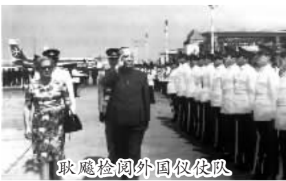
耿飽检阅外国仪仗队

问题”的指示,我对中巴两国间的有关历史进行了认真的调查研究。经过调研,发现有一个飞地坎居提问题,可以算是中巴关系史上尚未解决的悬案。