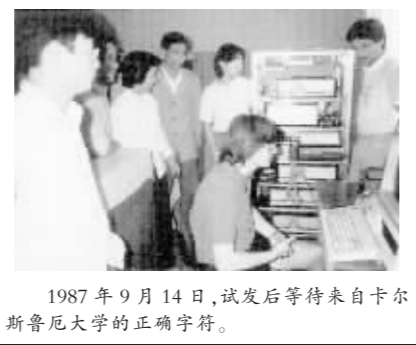
1987年9月14日,该发后等待来自卡尔斯鲁厄大学的正确字符。

我们研究组就在一台西门子7760大型计算机上做方案设计和实验。那时候没有Internet的概念,在计算机应用方面,发达国家对我们心存戒备,重要设备、技术都不向我们开放,计算机软硬件不兼容的问题非常突出。直到1987年7月,卡尔斯鲁厄大学的维纳、指恩教授从德国带过来可以兼容的系统软件,我们研究所的计算机才具备了与国际网络连接和发送电子邮件的技术条件。”