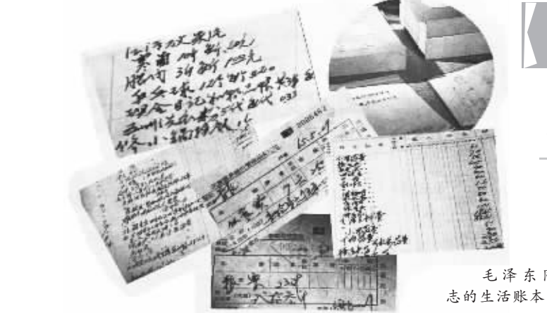
毛泽东同志的生活账本