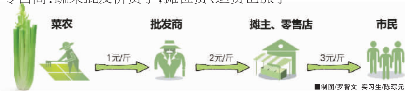
■制图/罗智文 实习生/陈琼元

本报《涨声之下》栏目推出后,有市民打进本报热线询问:据说从菜地里收购上来的芹菜不到1元/斤,到市场上的标价为何高达3元/斤?