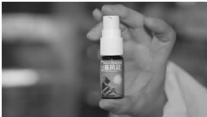
▲最新研制的痛风凝胶,不吃药治痛风获国家专利

据悉,由于解决了痛风吃药治疗的副作用难题,霍氏痛风灵已经获得国家重大发明专利证书(专利号 200510030810.2)。我市东塘楚仁堂大药房、芙蓉区:火