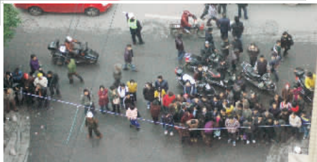
长沙市中山路,警方封锁了坠楼现场,附近居民和路过市民隔着警戒线关注事件进展。