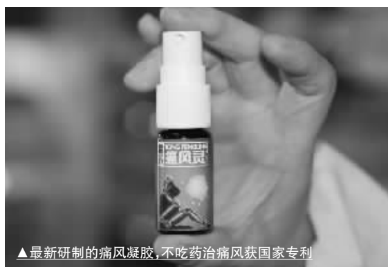
▲最新研制的痛风凝胶,不吃药治痛风获国家专利

我市东塘楚仁堂大药房、芙蓉区:火车站阿波罗药柜、誉湘大药房、火星镇楚济堂、车站楚明堂药房、天心区:平和堂(五一店/东塘店)、南门口好又多药柜、雨花区:红星步步高超市药柜、岳麓区:河西通程新一佳药号、西站康寿大药房、开福区:东风路楚仁堂药房、星沙:旺鑫大药房、浏阳:钰华堂大药房、望城:工