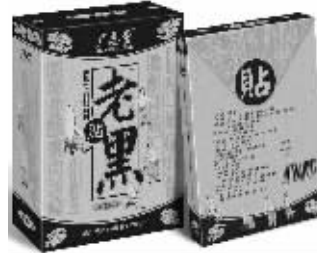
20盒一疗程 市内免费送货