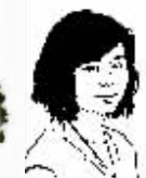
记者张颐佳 de法庭笔记

本报11月24日讯 日前,长沙市开福区组织全区干部进行干部学法用法考试,通过深入扎实的法制宣传教育和法治实践,推动全区法制管理工作。五年来,开福区通过组织法治培训班、法制专栏等多种形式推动社会化普法格局的形成,加强开福区领导干部在法制观念和实践能力、管理方式等方面的提高,促进了经济快速发展。 ■实习生 董苏雪 记者 王为薇