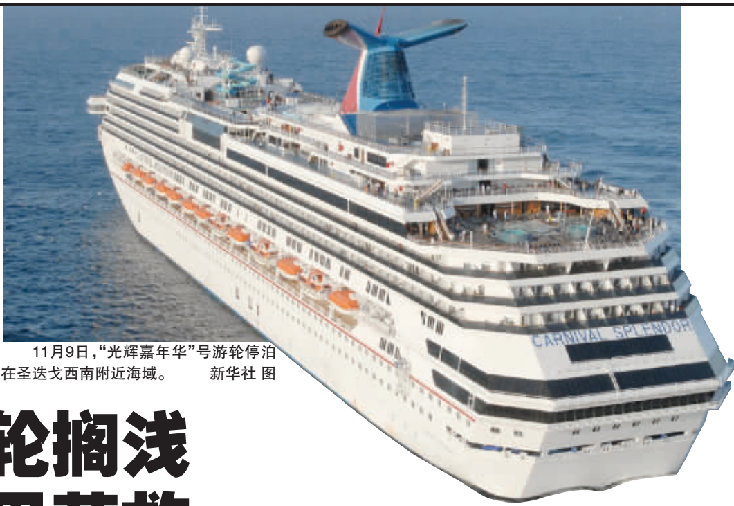
11月9日，“光辉嘉年华”号游轮停泊在圣迭戈西南附近海域。

第一艘拖船9日下午抵达事发海域，当晚开始把游轮缓缓拖向美国加利福尼亚州圣迭戈。美国海岸警卫队出动军舰和飞机向游轮运送食物。