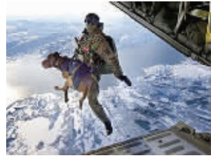
德国牧羊犬被空投到塔利班基地。