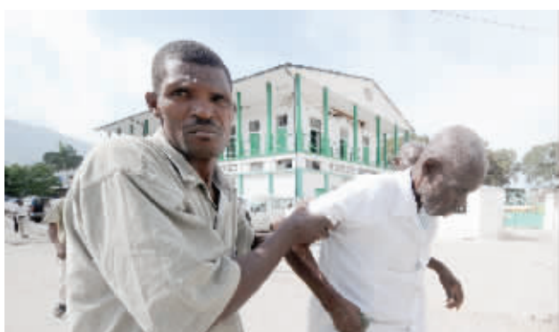
11月9日，在海地首都太子港，一名家属将霍乱病人送入医院。

蔓延。海地卫生局局长加布里埃尔·蒂莫特说，霍乱疫情是“关乎国家安全的事情”。他向美联社证实，截至8日，海地霍乱致死544人。