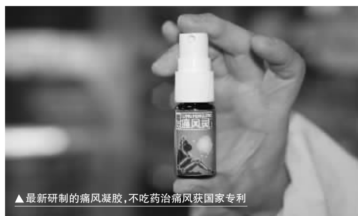
最新研制的痛风凝胶,不吃药治痛风获国家专利

我市东塘楚仁堂大药房、芙蓉区:火车站阿波罗药柜、誉湘大药房、火星镇楚济堂、车站楚明堂药房、天心区:平和堂