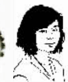
记者张颐佳 de法庭笔记