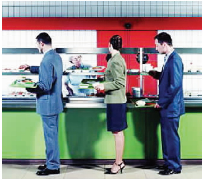
午餐吃什么,这个问题令不少白领感到头痛。(资料图片)

长沙市定王大厦19楼,时钟指向11点40分。白领小杨工作了一上午,翻开抽屉中的一叠外卖单,午餐吃什么这个问题对她来说,不会比思索人生意义更难。 “粗糙、乏味、不卫生、没营养”是长沙白领对午餐的评价,都认为花钱也吃不到一顿满意的午餐。这个难题怎么解决?从10月25日开始,长沙芙蓉区都正街街道将打造10000份“白领午餐指南”,让白领评出辖区内实惠、卫生、美味的餐饮单位。 ■记者 黄静