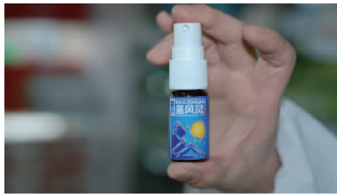
▲最新研制的痛风凝胶,不吃药治痛风获国家专利

据悉,由于解决了痛风吃药治疗的副作用难题,霍氏痛风灵已经获得国家重大发明专利证书(专利号 200510030810.2)。我市东塘楚仁堂大药房、芙蓉区:火