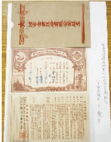
解放初期津市企业股份有限公司股权证。