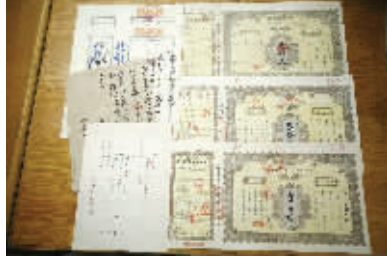
民国33年北京自来水公司股权证。