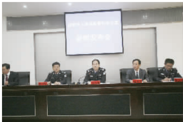
11月2日，益阳市交警三支队的会议室，“11·01案件”新闻发布会现场。