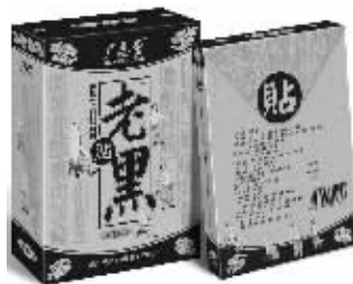
20盒一疗程 市内免费送货